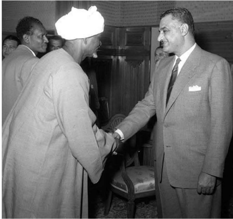
استقبال وفد أدباء العرب بقصر القبة ١٩٥٧